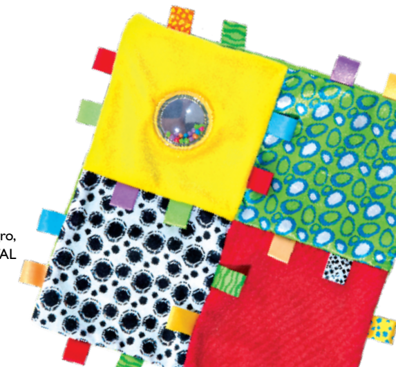
Χαλάκι Playgro, PRENATAL

Εσείς μπορεί να νομίζετε πως το μόνο που κάνει το νεογέννητο μωρό σας είναι να τρώει, να κοιμάται και... να λερώνει πάνες, η αλήθεια είναι όμως ότι από τις πρώτες μέρες της ζωής του έχει εκπληκτικές ικανότητες -ναι, και ας είναι μια σταλιά! Ακόμα βέβαια, δεν μπορεί να παίζει στην κυριολεξία, μπορεί όμως να εστιάζει σε πρόσωπα και αντικείμενα που βρίσκονται σε απόσταση 20-30 εκατοστά και να γυρίζει το κεφα-