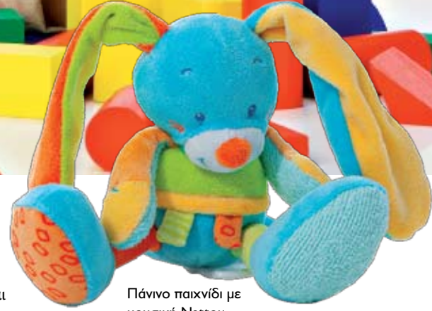
Πάνινο παιχνίδι με μουσική Nattou, PRENATAL

νικήτητά του, να εκφράσει τις σκέψεις και τα συναισθήματά του αλλά και να καλλιεργήσει τη φαντασία του. Βέβαια, για να τα καταφέρει όλα αυτά ένα παιχνίδι πρέπει να είναι ανάλογο της ηλικίας του παιδιού. Ποια είναι όμως τα ιδανικά παιχνίδια για κάθε ηλικία;