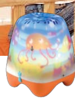
Συσκευή για μουσικό νανούρισμα FLEXA

Ο χρυσός κανόνας! Όπως μας συμβουλεύει η Δρ Κωνσταντίνα Γκόλττσιου «καλό είναι να μη φορτώνουμε το παιδί με πολλά παιχνίδια. Καθημερινά φροντίζουμε να καθόμαστε λίγη ώρα μαζί του στο πάτωμα με ένα παιχνίδι και να παίζουμε, προσπαθώντας να κρατήσουμε ζωντανό το ενδιαφέρον του. Εκείνη την ώρα, τηλεοράσεις, τηλέφωνα ή άλλες συζητήσεις δεν μας αποσπούν».