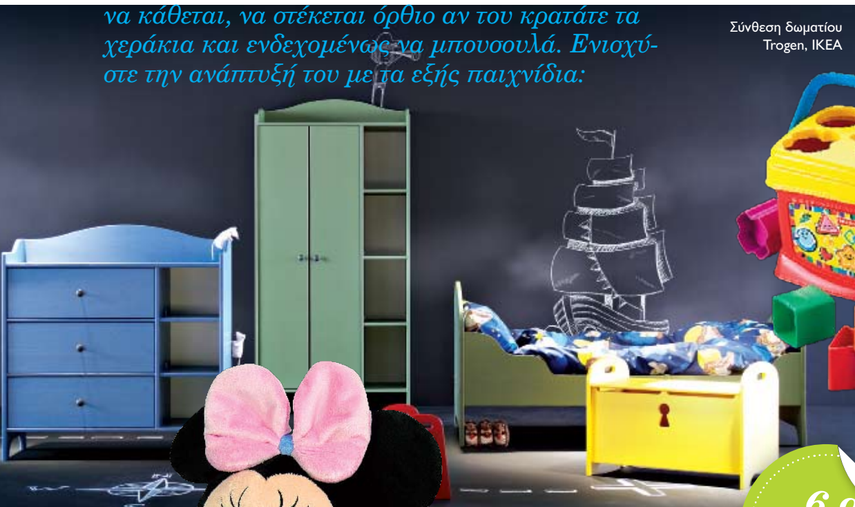
Κύβος με σχήματα FISHER PRICE