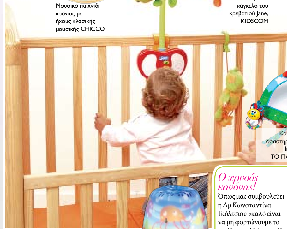
Καθρέφτης δραστηριοτήτων Infantino, ΤΟ ΠΑΙΧΝΙΔΙ

λάκι του προς την κατεύθυνση που ακούγεται θόρυβος. Τέλεια παιχνίδια που βοηθούν την ανάπτυξη της όρασης (παρατηρητικότητα - παρακολούθηση κίνησης), της ακοής και της αφής είναι τα εξής: ΜΟΜΠΙΛΟ. Κρεμάστε το στην κούνια και δώστε στο μωρό την ευκαιρία να παρατηρήσει τα χρωματιστά αντικείμενα να... χορεύουν στον ρυθμό της μουσικής. ΚΑΘΡΕΦΤΑΚΙ. Στερεώστε