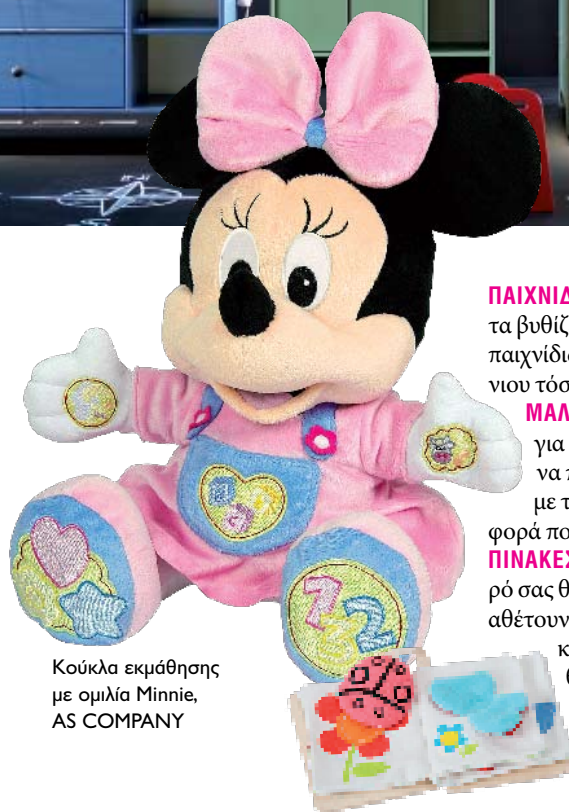
Κούκλα εκμάθησης με ομιλία Minnie, AS COMPANY