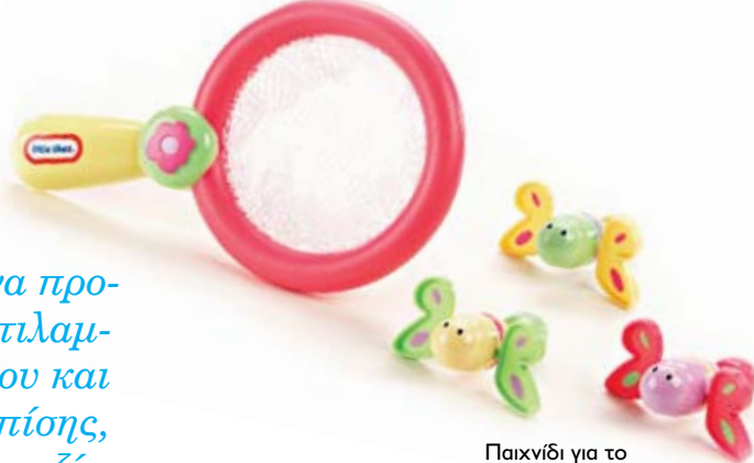
Παιχνίδι για το μπάμιο Little Tikes, GIOCHI PREZIOSI

Με τη διανοητική και κινητική ανάπτυξη να προχωρά με γοργούς ρυθμούς, το μωρό σας αντιλαμβάνεται πολύ καλά όσα συμβαίνουν γύρω του και αντιδρά με τον δικό του ιδιαίτερο τρόπο. Επίσης, αρχίζει να συμμετέχει ενεργά στο παιχνίδι μαζί σας αποκτώντας πλέον ενεργό ρόλο. Το διάστημα αυτό θα καταφέρει να στηρίξει το κορμάκι του και να κάθεται, να στέκεται όρθιο αν του κρατάτε τα χεράκια και ενδεχομένως να μπουσουλά. Ενισχύστε την ανάπτυξή του με τα εξής παιχνίδια: