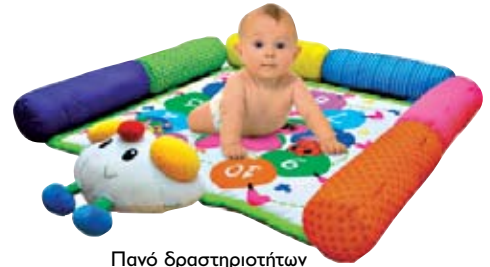
Πανό δραστηριοτήτων K's Kids, ΤΟ ΠΑΙΧΝΙΔΙ