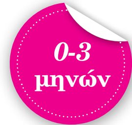
Παιχνίδι για το κάγκελο του κρεβατιού Jane, KIDSCOM