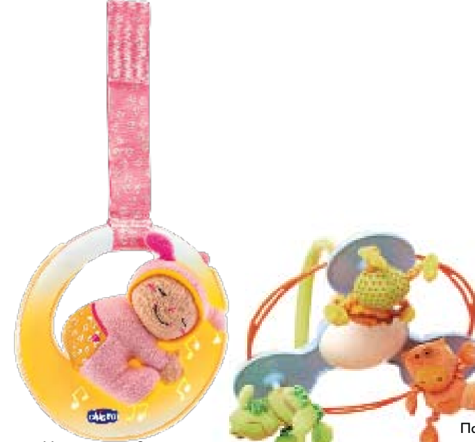
Μουσικό παιχνίδι κούνιας με ήχους κλασικής μουσικής CHICCO