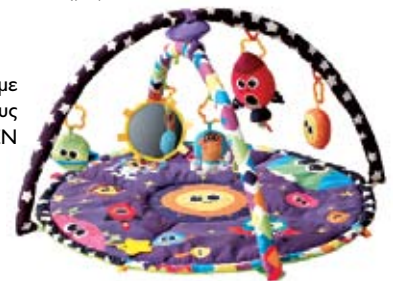
Γυμναστήριο με κίνηση και ήχους ΟΙΚΟΠΕΝ

ΠΑΙΧΝΙΔΙΑ ΚΑΡΟΤΣΙΟΥ. Θα κάνουν την παραμονή του στο καρότσι ευχάριστη αλλά και τις βόλτες σας ακόμα πιο ενδιαφέρουσες – και πιο ήρεμες!